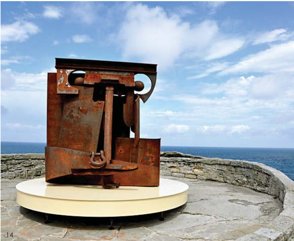
12 硬化 马修 13 海的细胞 露西·巴克 14 王 安东尼·卡罗 15 不可抗力 米米·丹尼特 16 风兆 松本熏 17 古铜色的澳洲系列——生命夹克 尼克·斯坦科思 (以上为2010年作品)