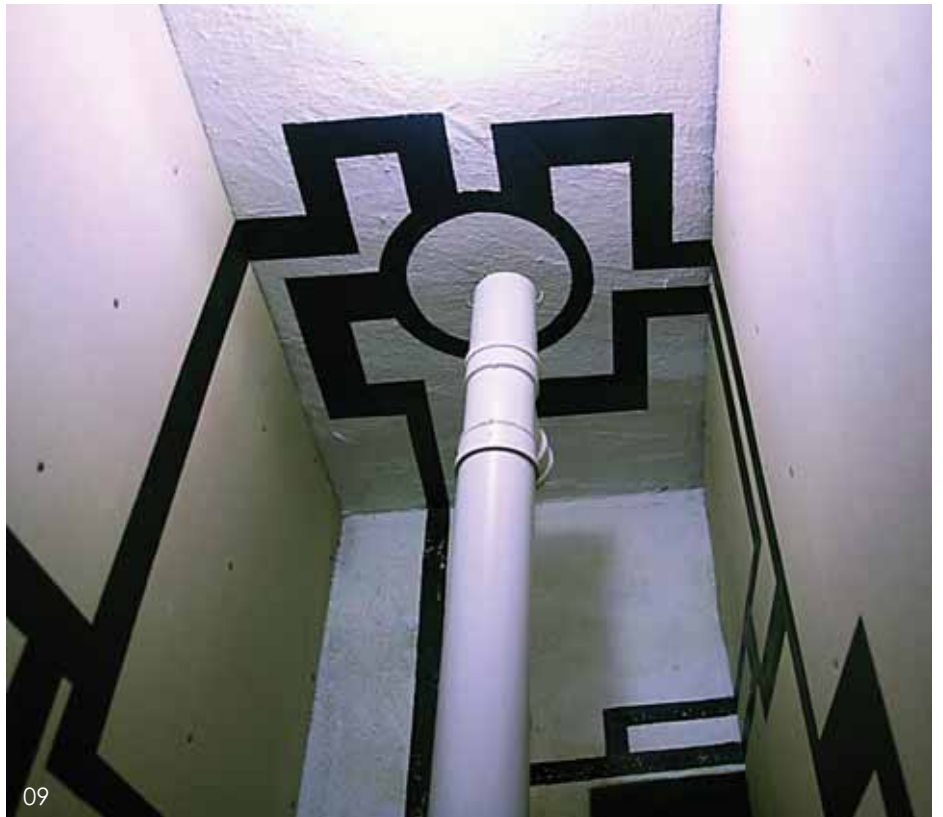
08 锅炉 集体创作 09 转换 李世凯