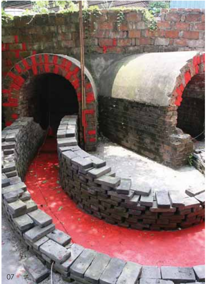
06 金刚四句偈 刘兆丰 07 锅炉 集体创作