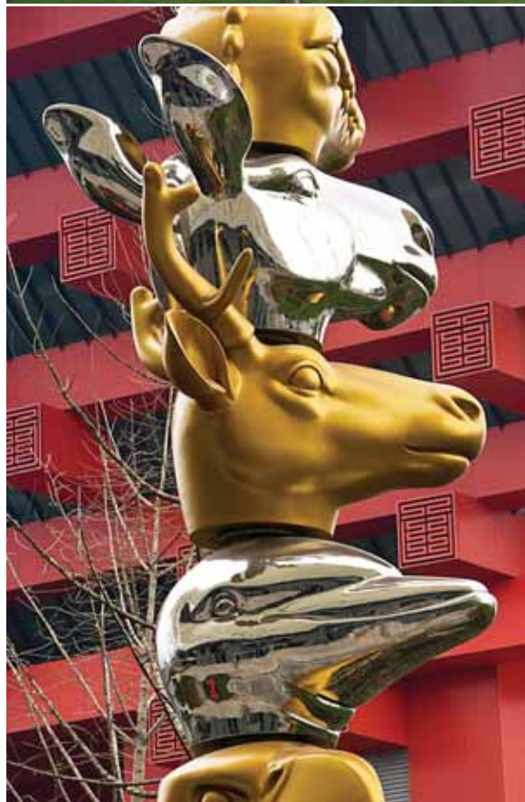
> 帕斯卡·马塞恩·塔尤 《上海树—米卡多树》 2010 铝, 喷漆, 混凝土 850 × 400 × 400 (厘米)