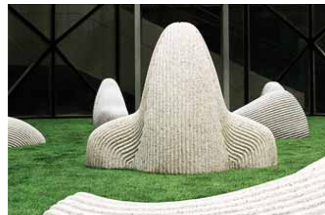
黄致阳 《座千峰》 2009 20块雕刻的花岗岩组成的山脉 不规则尺寸