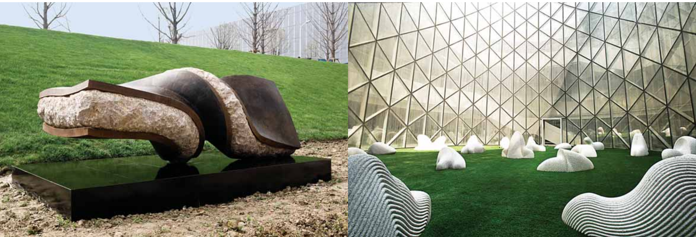
李颂华 《无题》 2009 铁, 花岗岩 301 × 86 × 103 (厘米)