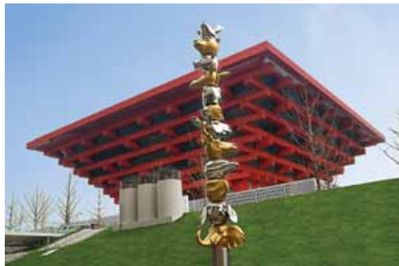
< 陈长伟 《十二生肖柱》 2009 不锈钢喷漆 180 × 180 × 1200 (厘米)