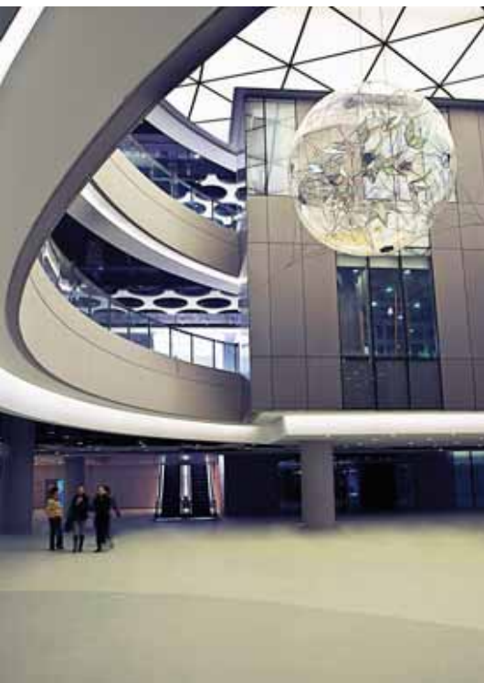
托马斯·萨拉切诺 《花园飞行器》 2010 透明镜像箔，太阳能电池板，黑绳，织带 不规则尺寸