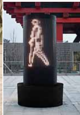
03 朱利安·奥培 《三人行》 2008 LED (环形) 205 × 135 × 135 (厘米)