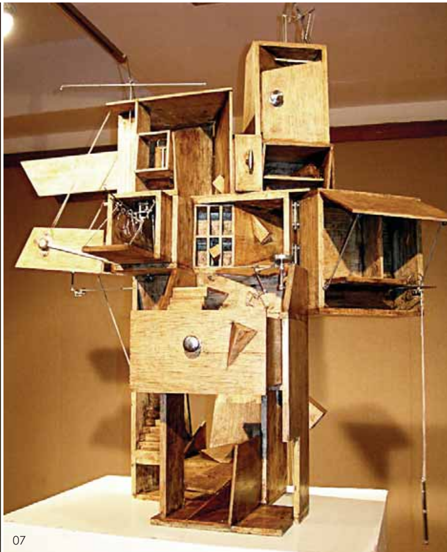
06 构建始于1980 木 陈政 07 一只鸟的幻想空间 木 陈政

周长勇是中央美院雕塑系 2010 年毕业的硕士研究生，他曾经是海军潜艇学院的软件教员。这次的参展作品题为《四十万公里》，是一个用三维 LED 点阵构成的行走的人，或者更确切地说是行走的动态本身。隋建国称之为“第一个三维动态 LED 雕塑”。