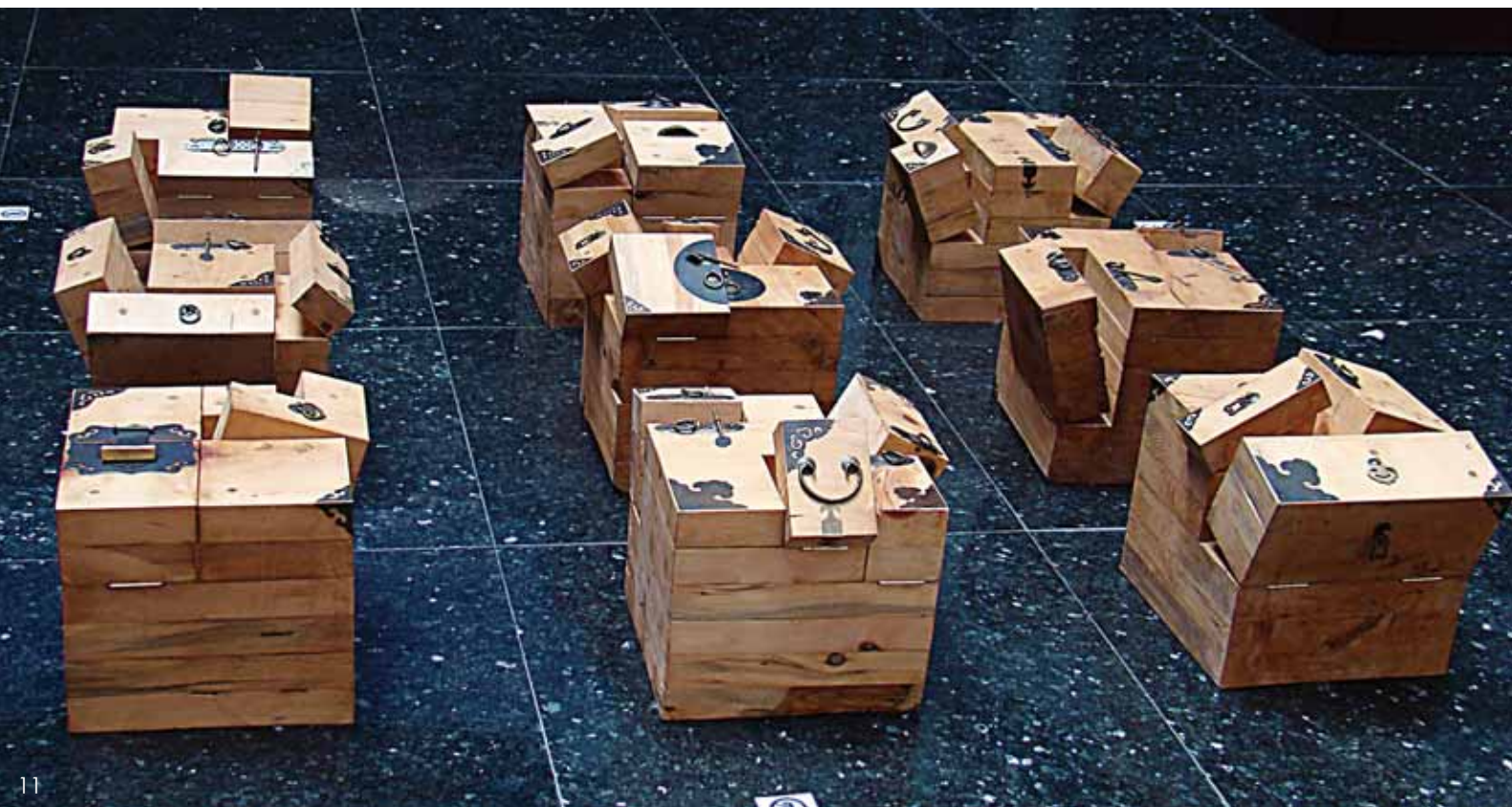
11 九个一立方尺 红松 33cm × 33cm × 33cm (共计9个) 2010年 韩文华