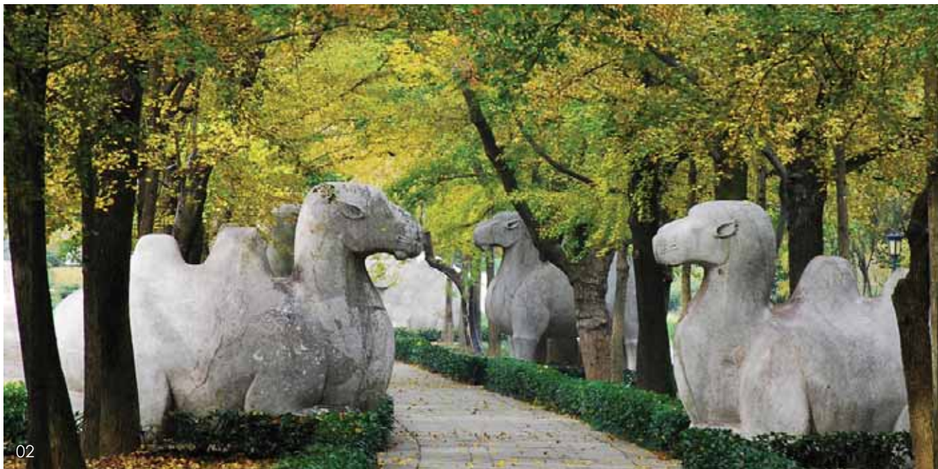
01 徐州汉兵马俑 02 明孝陵神道 03 栖霞寺舍利塔

表着江苏雕塑艺术历史上的最高成就。江苏境内的南朝陵墓石雕有33处，集中分布在南京、句容、丹阳一带。这些陵墓前石雕艺术，古朴凝重，精美绝伦，堪称艺术瑰宝。它上承秦汉，下启隋唐，与北朝石窟艺术遥相媲美，在中国石雕艺术史上占有极其重要的地位。随着佛教文化的传入，隋、唐、宋、元时期雕塑佛像盛行。南京栖霞山千佛崖，是我国东南地区规模最大、造像数量最多、凿窟时间跨度最长的一处石窟艺术宝库。在其栖霞寺东侧，有始建于隋经南唐重修的舍利塔，高约18米，五级八面密檐式，雕刻狮、凤、飞天、力士、天王、文殊、普贤等佛教形象，尤其是塔基座上刻有释迦牟尼成道八相图浮雕，精美生动，为唐宋时期江南石刻艺术之杰作。苏州吴县甬直保圣寺有9尊罗汉坐像，造型伟岸，表情深沉，神韵各具，十分生动，是现存较早的中国化罗汉艺术形象佳作之一。灌云伊芦山六神台佛教造像共有42尊。其中一窟东壁上有高浮雕像6尊，5尊结跏趺坐于莲台上，其旁有一尊力士像，是盛唐时期的作品。吴县天池山寂鉴寺石屋阿弥陀及弥勒石刻是元代作品，佛像依山崖凿成，其线条粗犷，气势逼人，是古代工匠因地制宜进行石刻造像的成功范例。明清时期，各类材料雕刻更加丰富，江苏以石刻、泥塑、木雕、砖雕颇具特色。位于南京东郊钟山南麓的明孝陵神道两侧的石人石兽体型巨大，形神兼备，是明代石刻的艺术珍品。在明清时期的雕塑领域里，最有创造性和时代气息并与民众文化生活相关联的，还有那些小型雕塑品。如竹、木、砖、象牙、玉雕、牙雕等以文人雅好为趋向，雕刻工细，传世佳品颇丰。